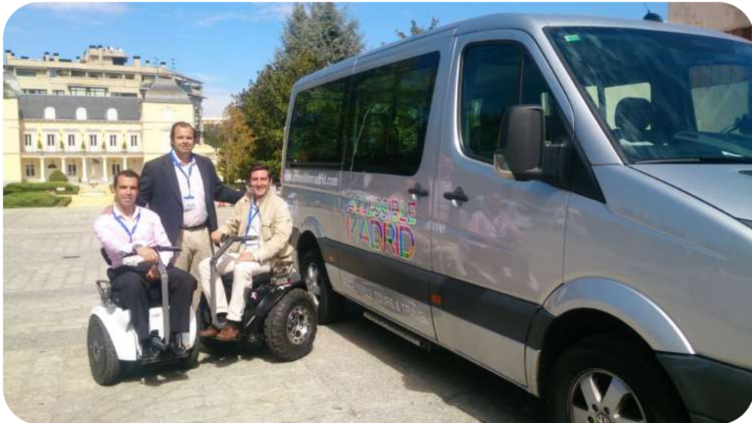
Socios-fundadores de Accessible Madrid